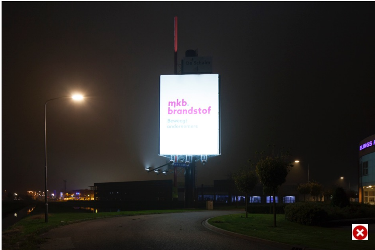
Foto: Bedrijventerrein De Schelm in Andelst/Heteren. Leddisplays en lichtkranten zien we steeds vaker. Deze kunnen de verkeersveiligheid niet ten goede komen.

Bij een opvallende en storende lichtbron gaat Overbetuwe in gesprek met de ondernemer/eigenaar van het pand. Gezamenlijk wordt bekeken wat de mogelijkheden zijn om onnodige lichthinder te verminderen of te voorkomen. Met invoering van de Omgevingswet wordt ook naar dit aspect gekeken.