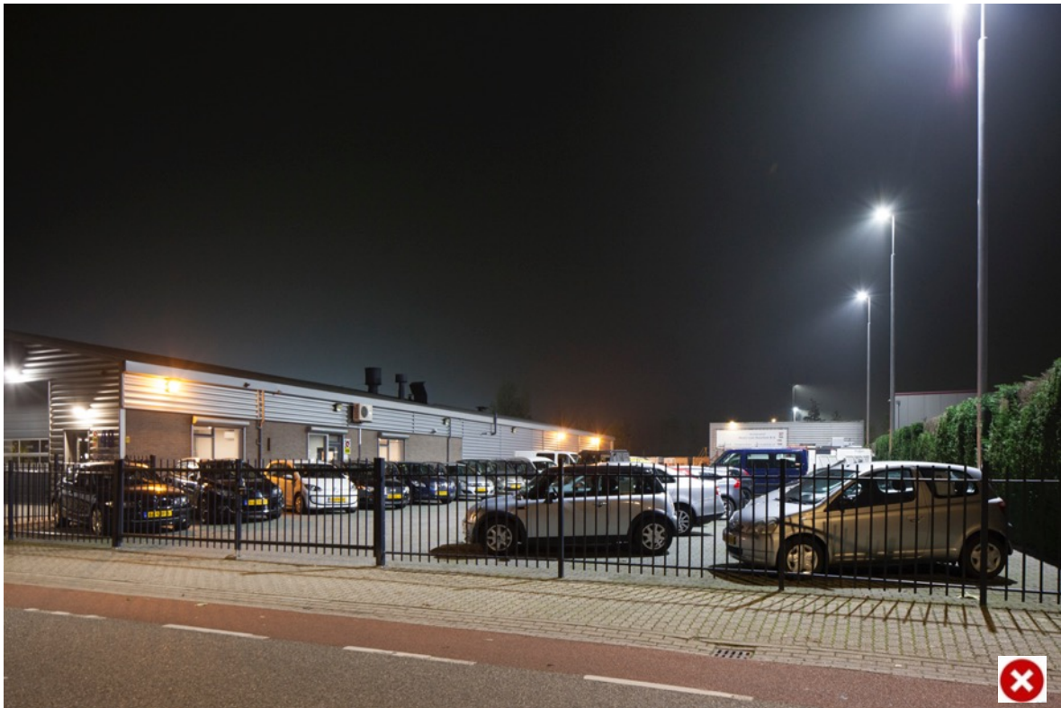
Foto: Andelst/Herveld. Fel licht op een afgesloten terrein dat ook op de openbare weg valt. De straatverlichting valt hierdoor weg. Een goede afstemming is belangrijk.

Al het licht bij elkaar bepaalt het beeld op straat. Soms zien we dat door de felheid van het licht een reclamebord in de avonduren niet eens leesbaar is in de avond. Of het licht van een bedrijf is van verre zichtbaar. Soms werkt een bedrijf 24/7, dan is er altijd licht nodig. Maar ook dan kan bekeken worden hoe de lichtuitstoot minder kan.