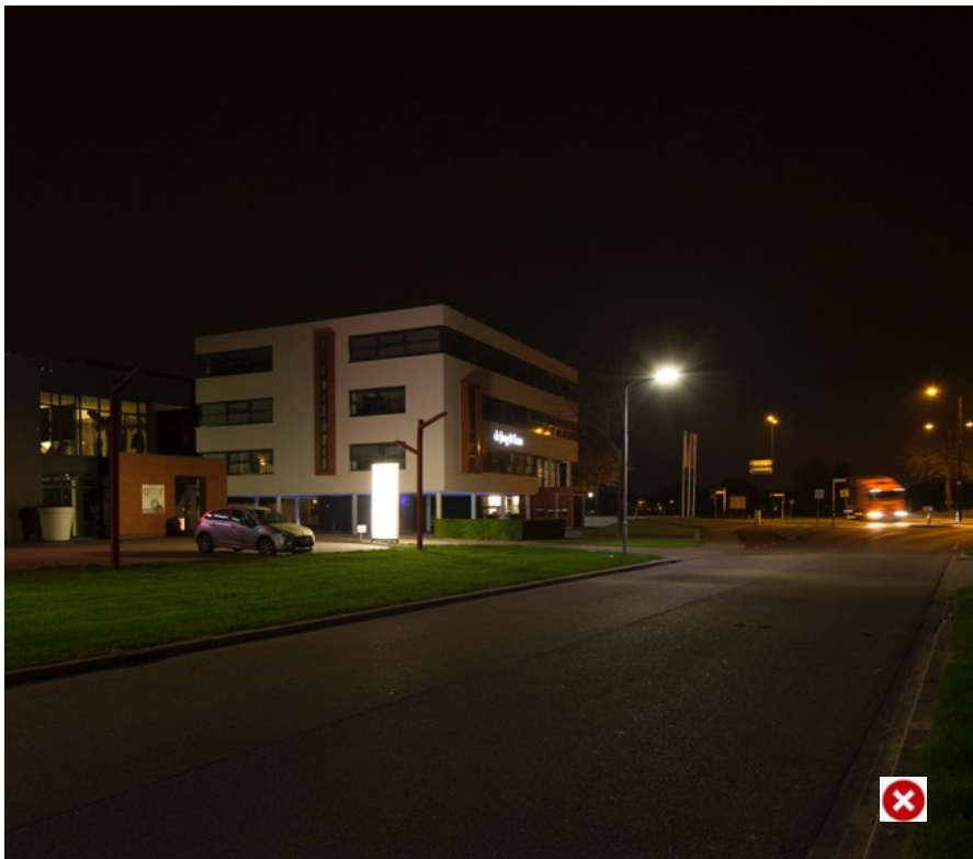
Foto: Pascalweg in Elst. Lichtbak is zo fel dat het niet leesbaar is.

Al het licht bij elkaar bepaalt het beeld op straat. Soms zien we dat door de felheid van het licht een reclamebord in de avonduren niet eens leesbaar is in de avond. Of het licht van een bedrijf is van verre zichtbaar. Soms werkt een bedrijf 24/7, dan is er altijd licht nodig. Maar ook dan kan bekeken worden hoe de lichtuitstoot minder kan.