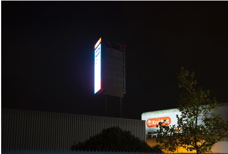
Foto: Heteren, led display van kilometers ver zichtbaar.

Bij reclame gaat het niet alleen om verlichte naamborden en gevels. Door de opkomst van led zien we steeds meer zogenoemde led displays. Led displays hebben vaak bewegende of knipperende beelden die frequent wisselen. Ze staan geregeld op hoge masten zodat ze van verre zichtbaar zijn.