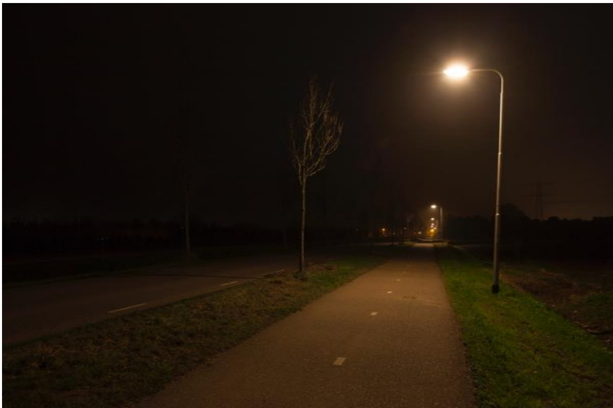
Foto: Verbindingsweg in Andelst. Voorzien van oriëntatieverlichting.

- Hoofdfietsroute : Binnen de kom worden deze altijd verlicht. Buiten de kom zijn enkele hoofdfietsroutes nu verlicht door middel van oriëntatieverlichting. De routes kunnen of voorzien van directe verlichting (lantaarnpaal op de route) of indirect (door licht vanaf de rijbaan).