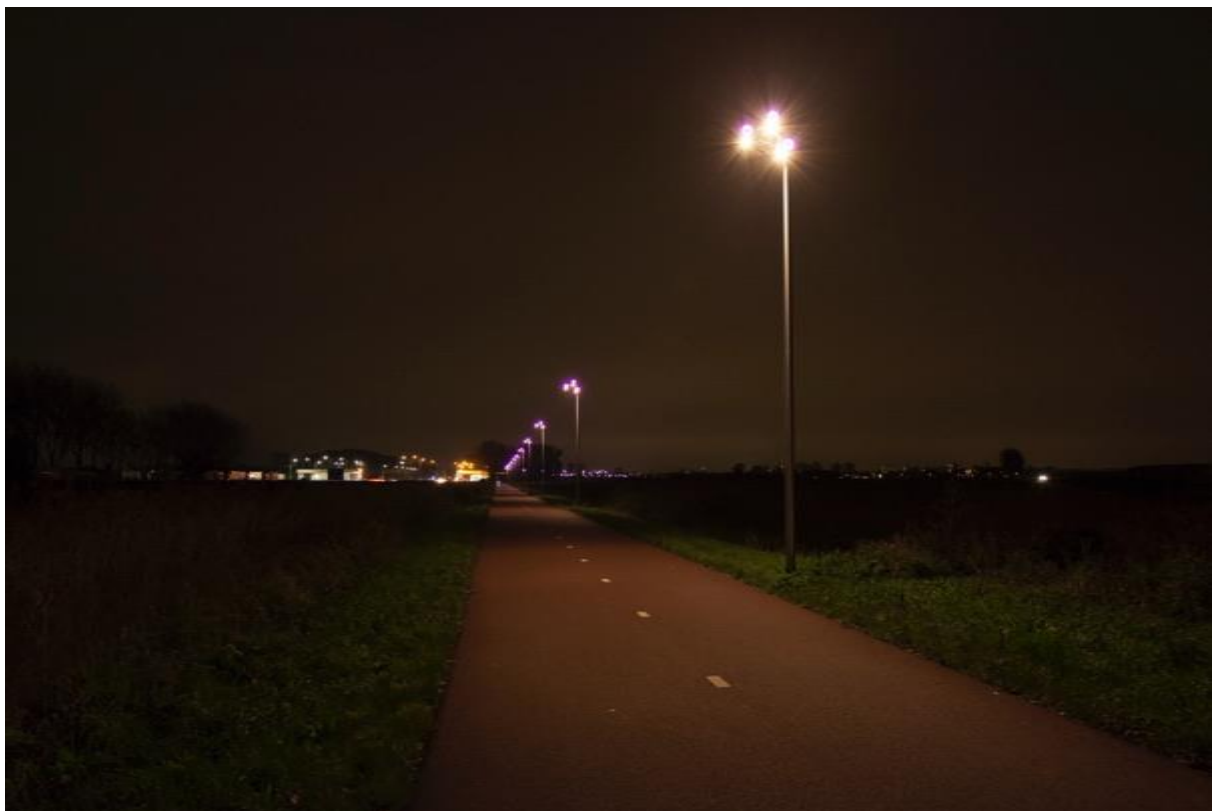
Foto: Rijnwaalpad, hoofdfietsplusroute.