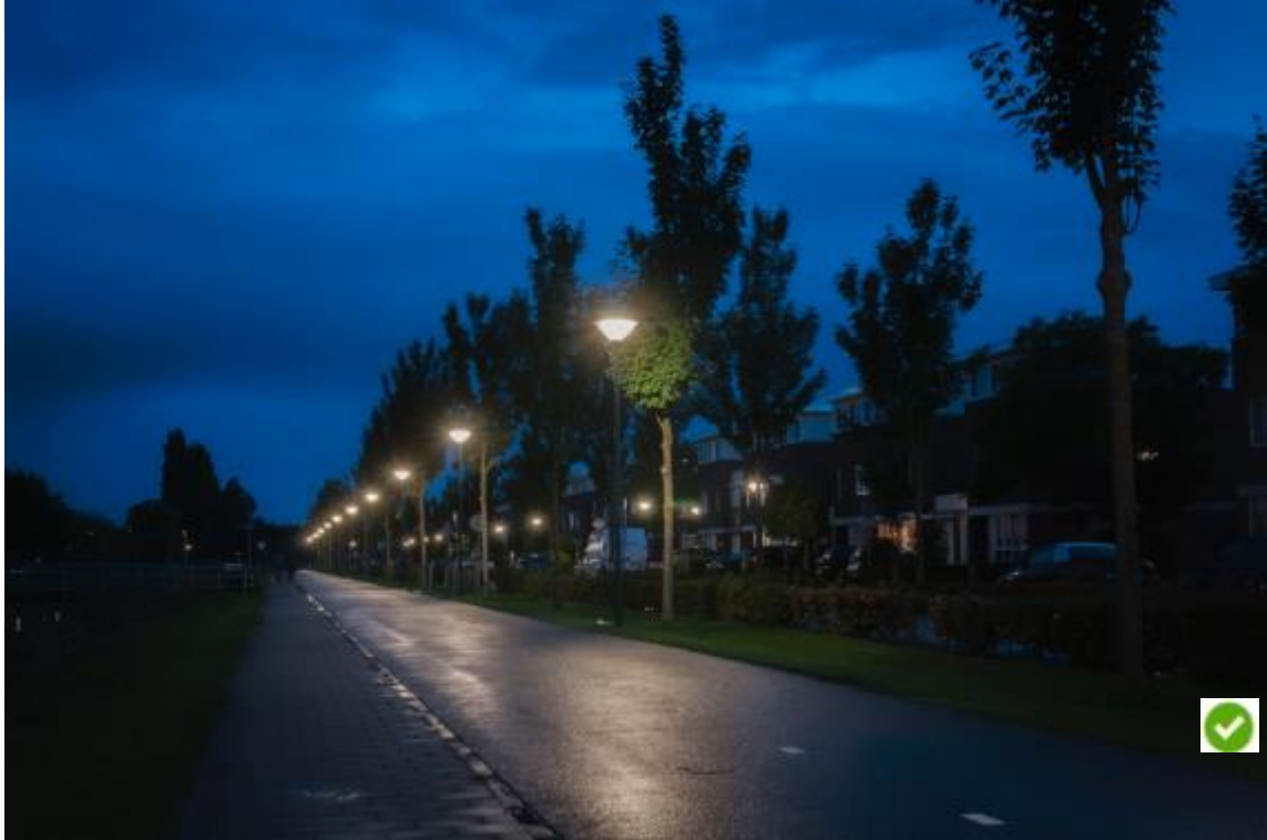
Foto: Lange Dreef in Elst fietsroute Regenboog. Doorgaande fietsroute binnen de kom.

- Hoofdfietsroute : Binnen de kom worden deze altijd verlicht. Buiten de kom zijn enkele hoofdfietsroutes nu verlicht door middel van oriëntatieverlichting. De routes kunnen of voorzien van directe verlichting (lantaarnpaal op de route) of indirect (door licht vanaf de rijbaan).