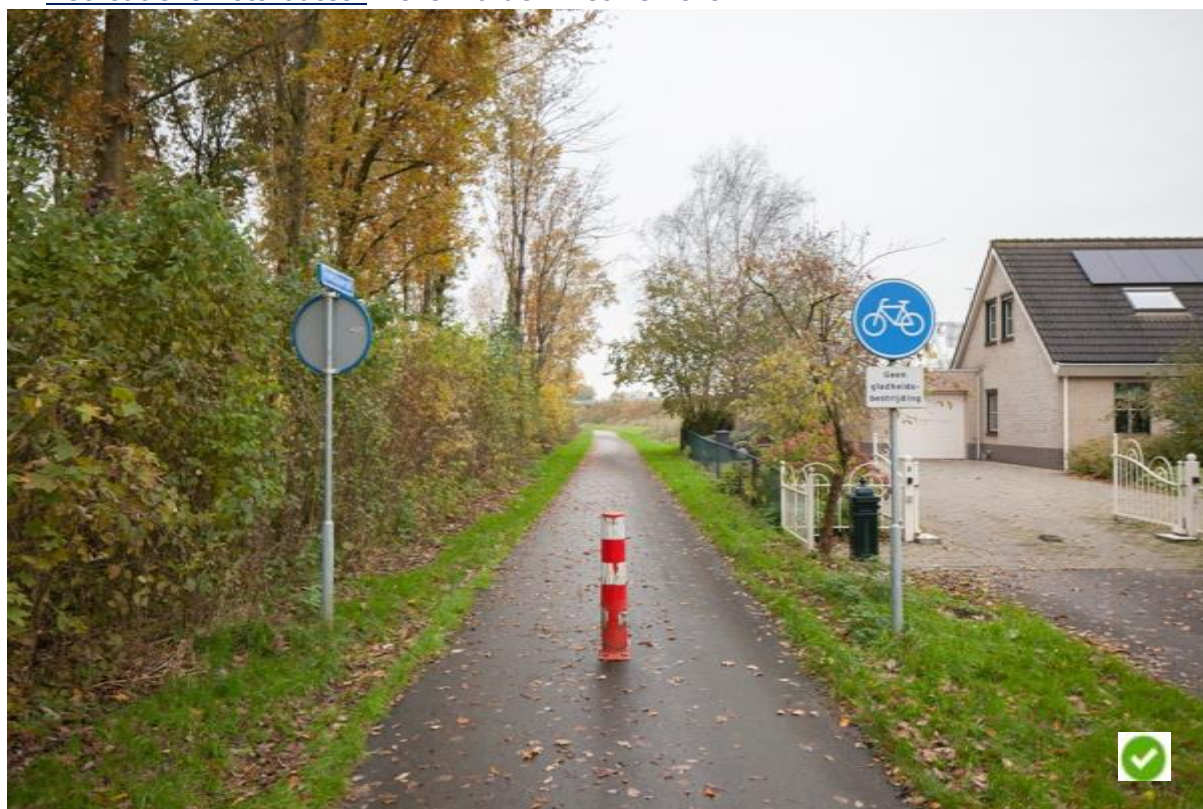
Foto: Houtakkers in Herveld. Recreative fietsroute die niet verlicht is.