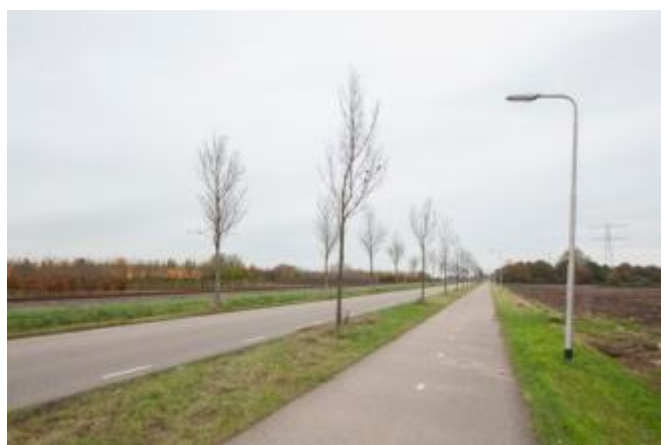
Links: Zeegstraat in Valburg waar de hoofdfietsroute op de weg loopt en rechts de Verbindingsweg in Andelst waar de hoofdfietsroute naast de weg loopt.