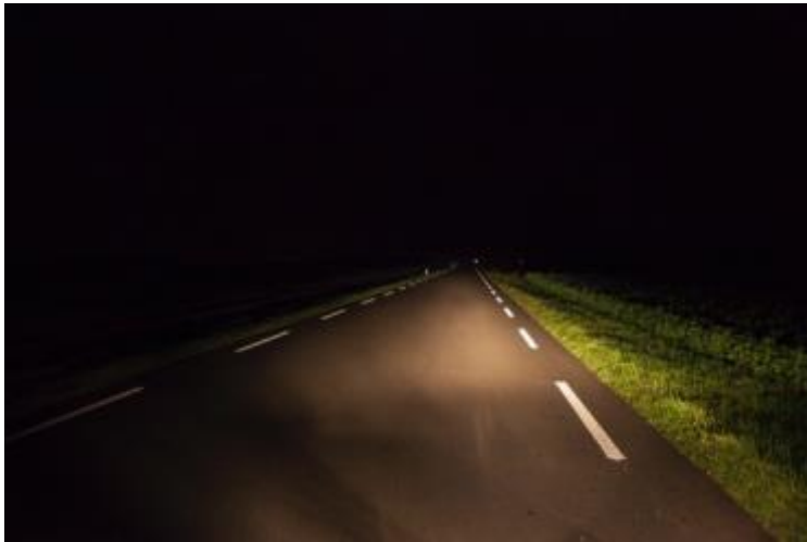
Foto: markering op de weg die je bijvoorbeeld kan toepassen bij een bocht.

Veel fietsroutes lopen door het buitengebied van onze gemeente heen. Vaak ook door gebieden waar ook de flora en fauna belangrijk is. Er zijn drie scenario's voorgelegd. Scenario 1: Geen openbare verlichting in het buitengebied. Op die plekken waar de verkeersveiligheid in het geding komt, wordt gebruik gemaakt van markering en reflectie. Denk aan strepen op de weg, schrikhekken en dergelijke.