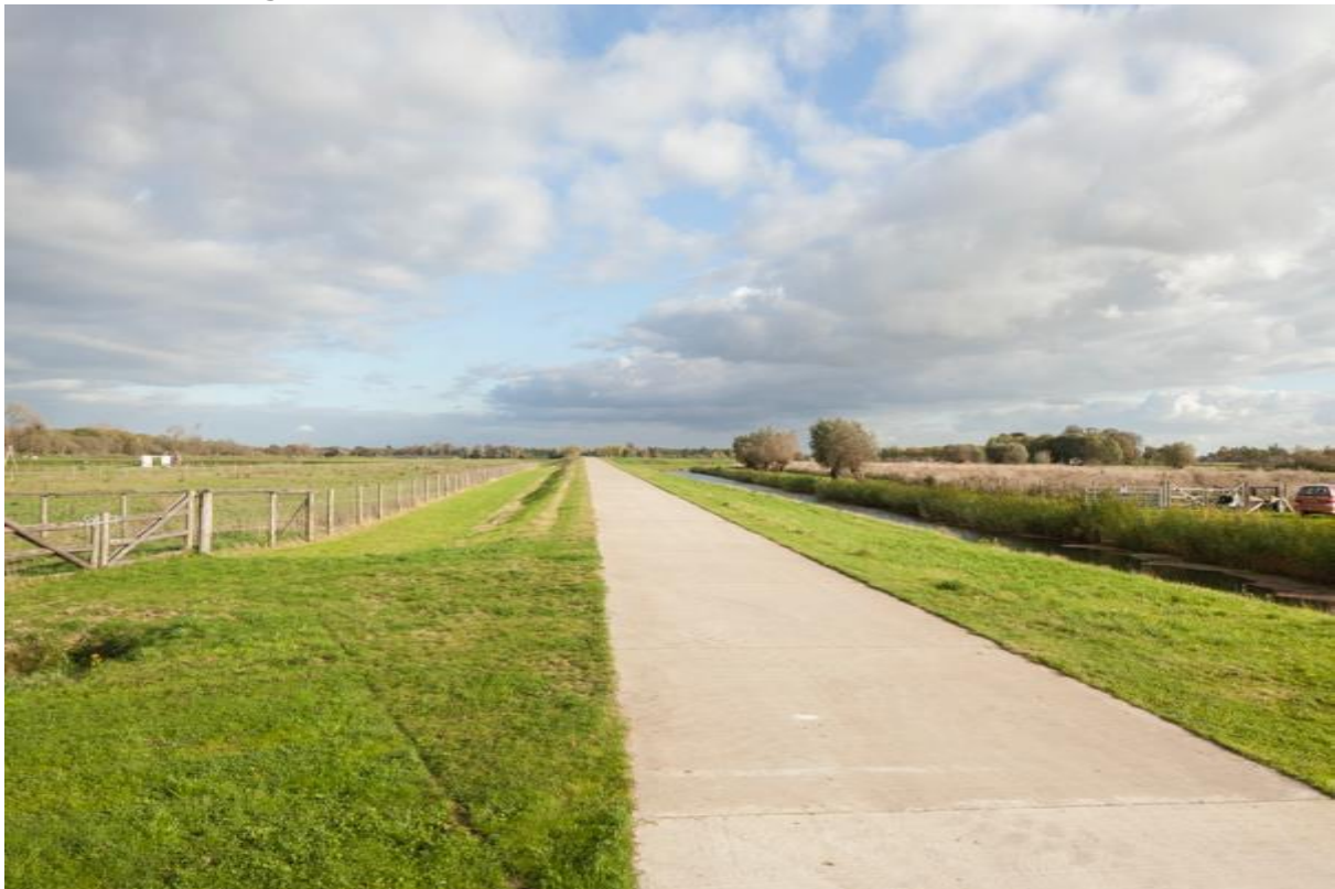
Foto: Recreatieve fietsroute door Park Lingezege in Elst.