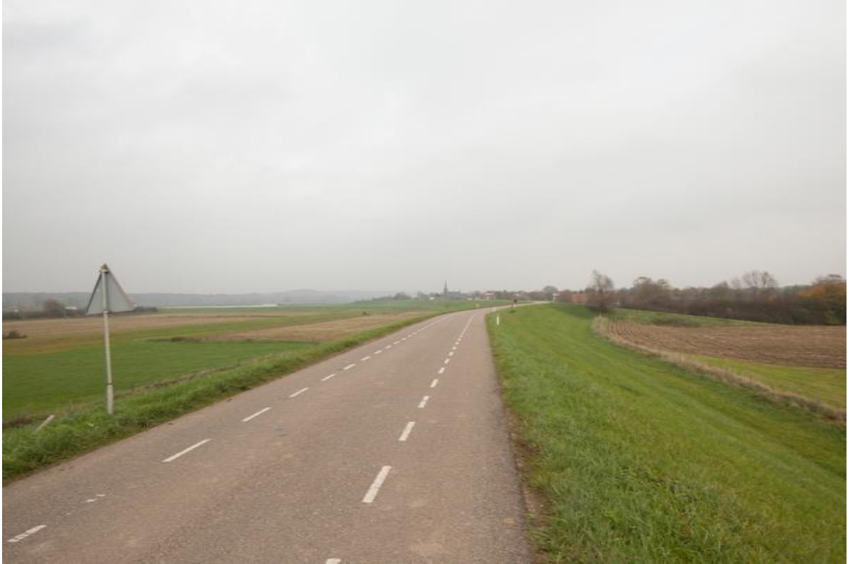
Foto: Randwijkse Rijndijk in Heteren, doorgaande fietsroute op de rijbaan.