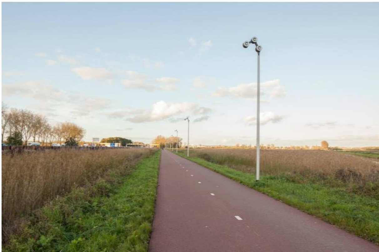
Foto: Rijnwaalpad in Elst. Hier zijn afspraken over gemaakt met de provincie en omliggende gemeenten om zo uniformiteit te hebben op de hele route.

Ongeacht het soort fietsroute, liggen sommige fietsroutes op de rijbaan, naast de rijbaan of los. Dit bepaalt ook mede de verkeersveiligheid. Als een fietsroute op de rijbaan ligt, is er een grotere kans op een conflict tussen een auto en fietsers, dan wanneer het fietsroute niet op de rijbaan ligt.