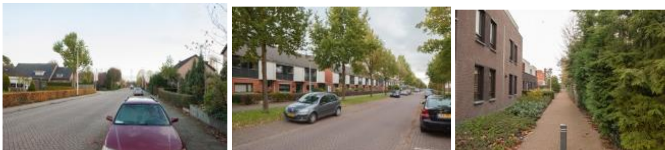
Foto: Voorbeeld van voetpad langs de weg, een voetpad langs de weg maar gescheiden door groen en een los pad tussen de wijken door.

In Overbetuwe hebben we veel voetpaden. Er zijn losse voetpaden, voetpaden die langs de weg liggen en fietspaden die door struiken/grasveld van een rijbaan gescheiden worden.