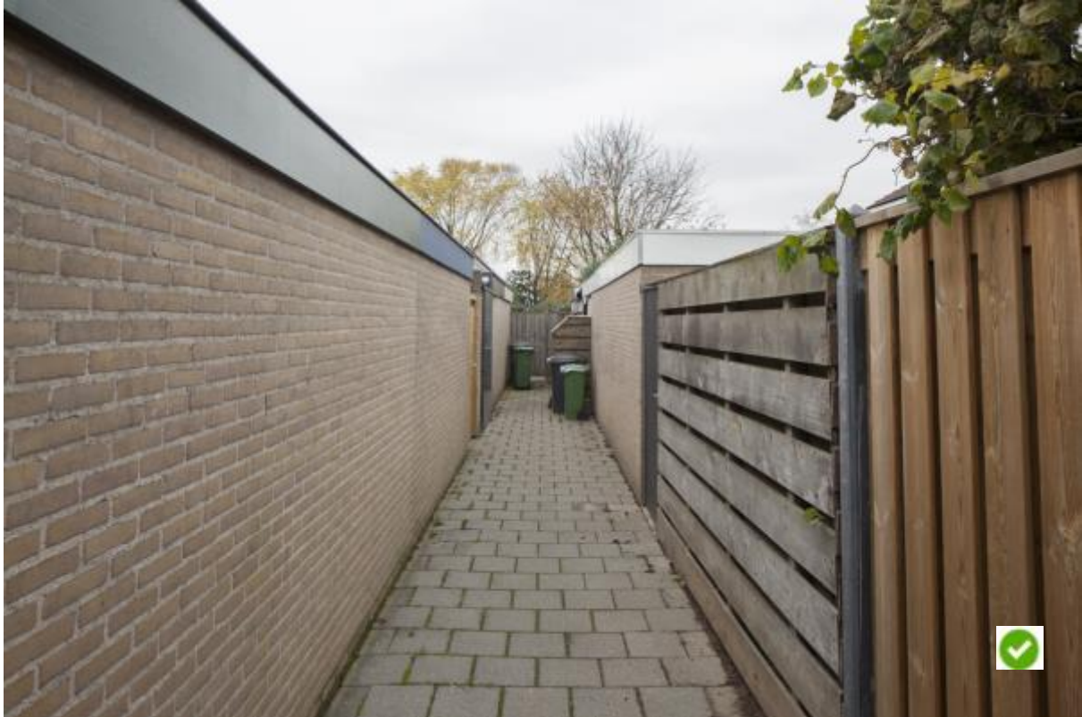
Foto: Johan Frisostraat in Andelst, Achterpad niet verlicht.

Achterpaden zijn paden die achter de huizen langs lopen. Dit zijn vaak smalle paden om toegang te krijgen tot de achtertuinten. De achterpaden in eigendom van de gemeente, zijn niet verlicht. Er zijn ook veel achterpaden in eigendom van de woningbouwvereniging. Die bepalen zelf waar verlichting staat.